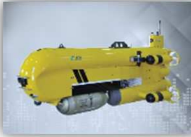
Systèmes Intelligents de Sûreté